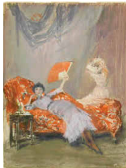
Ci-DESSUS Milly Finch huile sur toile

Son habitude d'intituler ses œuvres de termes musicaux choquera plus encore. Harmonie en gris et vert ; Variations en bleu et vert et même Variation en chair et vert ... Autant de titres incompréhensibles à la critique de l'époque incapable d'admettre que la combinaison de coloris puisse importer plus que le sujet du tableau. Cette critique qu'il n'aura d'ailleurs de cesse de vilipender (et de se mettre à dos)