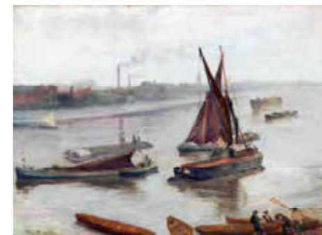
CI-DESSUS Gris et argent - Old Battersea Reach huile sur toile

Et si les journaux s'intéressent tant à lui c'est parce que, plus que tout autre peintre, il fut le créateur de sa propre marque. Sa mèche de cheveux blancs dans sa crinière noire qu'il portait comme un