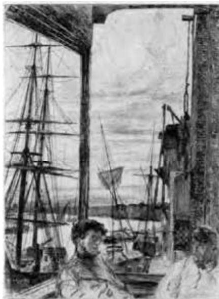
CI-DESSUS Rotherhithe, 1860 eau-forte et pointe sèche 27,4 x 20,1 cm Washington, Freer Gallery of Art, Smithsonian Institution @ Awesome art

talisman et qu'Apollinaire proposera de mettre au nombre des constellations, ses habits délirants qu'accompagnaient de singuliers chapeaux, ses sempiternelles provocations, toutes ces manières, en plus de lui procurer un plaisir certain, servaient d'une façon très pensée à gérer l'image de son personnage qu'il tenait d'ailleurs en plus haute estime comme le montreront ses démêlés avec Oscar Wilde (tout aussi anticonformiste) qui fut son meilleur ami avant qu'il ne le rejette comme il le fera avec nombre de ses relations.