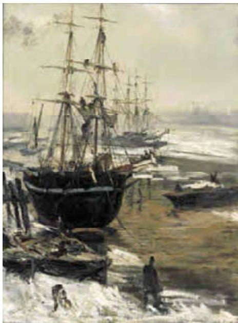
CI-DESSUS La Tamise gelée, 1860 huile sur toile 74,6 x 55,3 cm Washington, Freer Gallery of Art, Smithsonian Institution

Whistler est à la fois un type épatant et un peintre merveilleux, bien plus important que ce que lui réserve l'histoire de l'art en France. S'il occupe cette situation de seconde zone c'est parce que, venu d'Amérique, il a quitté la France pour l'Angleterre après y avoir appris le métier dans l'atelier de Gleyre, et qu'inclassable, puisqu'ayant refusé de s'inscrire dans le mouvement impressionniste, il ne peut être considéré comme un peintre national. Or, c'est justement d'être parti qui lui a permis de devenir cet artiste indépendant et joyeusement révolutionnaire qui a poussé la peinture aux limites de l'abstraction.